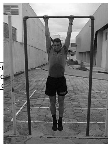
Fi Po Final