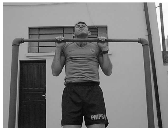
Figura 02 Posição 2 Intermediária.