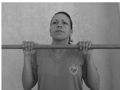
Figura 02 Detalhe de Execução do Teste