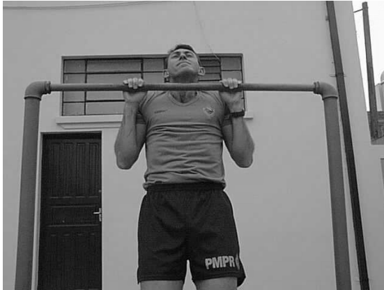
Figura 02 Posição 2 Intermediária.