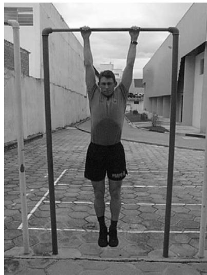
Figura 03 Posição 3 Final do Exercício