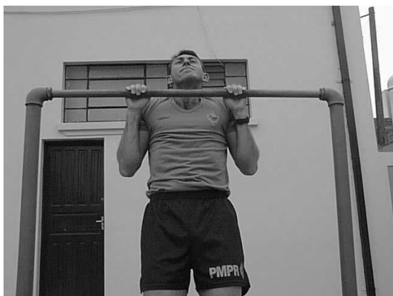
Figura 02 Posição 2 Intermediária.