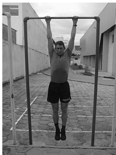
Figura 03 Posição 3 Final do Exercício