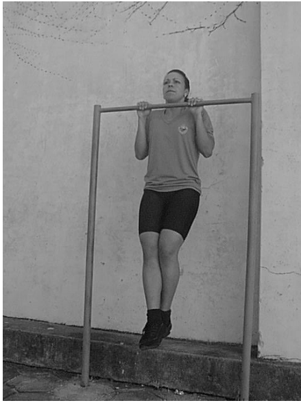
Figura 01 Posição de Execução do Teste